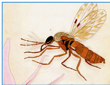
Polinizador del cacao Forcypomia sp.