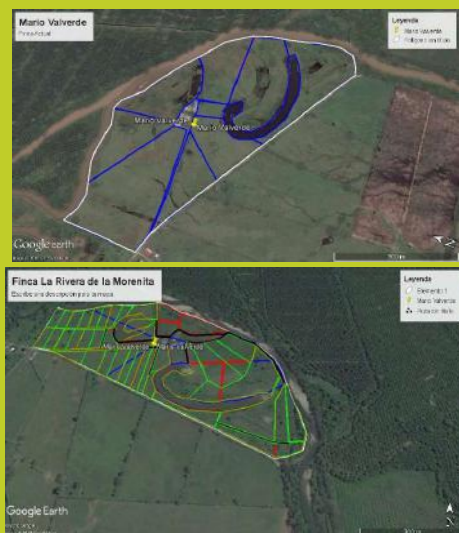
Figura 2. Croquis de distribución inicial de potreros y de apartos luego de la intervención.

pastura y bosque (Figura 1). Donde se observó que las pasturas cuando son bien manejadas incrementan la cantidad de carbono orgánico y no producen compactación del suelo. Aunque en este caso es necesario mejorar los contenidos de nitrógeno de los suelos bajo pasturas para alcanzar los niveles del bosque en los primeros 40 cm de profundidad.