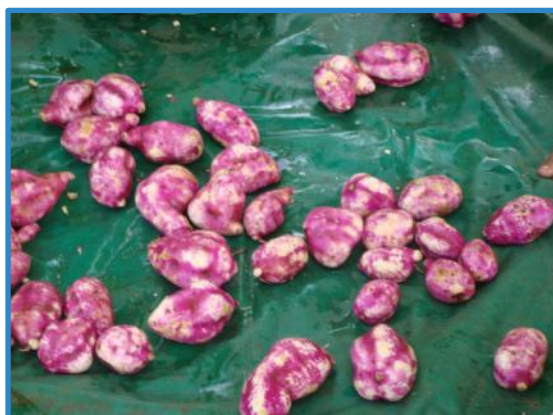
Figura 9. Camote lavado. Pococí, Costa Rica, 2016.

Según Lardizábal (2003) el tubérculo a comercializar debe ser lavado para eliminar de esta manera los remanentes de tierra que hayan podido quedar adheridos a la piel de este, también menciona que durante el proceso de lavado se debe de tener cuidado para no provocar abrasiones en la piel, aspecto que disminuye la calidad del mismo (Figura 9).