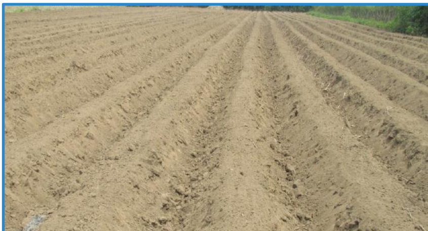
Figura 1. Terreno listo para sembrar las guías de camote. Pococí, Costa Rica, 2014.

El camote es un cultivo igual que las otras raíces tropicales, requiere una buena preparación del suelo, debe estar libre de piedras y troncos. Se debe hacer una rotura del terreno mediante un pase de arado, preferiblemente arado de cincel para romper capas que se hayan formado en el terreno, luego se recomienda un pase de rastra para afinar los terrones formados, para garantizar una buena aireación del suelo y permitir la penetración de las raíces, además, permite realizar un control de malezas y finalmente un alomillado con una altura entre 40-50 cm, para permitir un buen desarrollo de los tubérculos y evitar mal formaciones que afecten su comercialización (Figura 1). Otro de los métodos de preparación del terreno es con el apoyo de un arado con tracción animal o en áreas pequeñas, aflojado y alomillado con pala (Murillo 2009; González 1984).