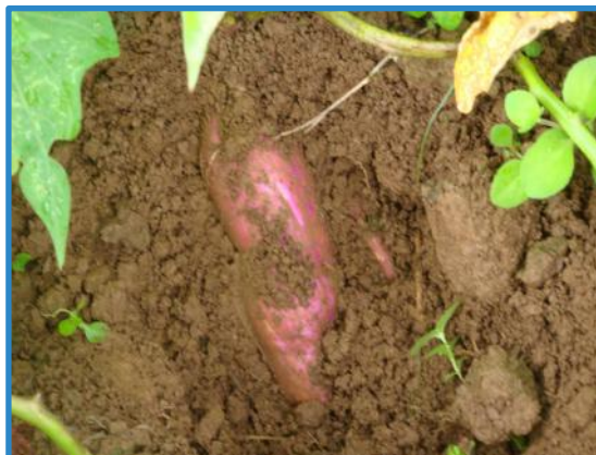
Figura 8. Camote listo para la cosecha. Pococí, Costa Rica, 2020.

En nuestro país, el camote criollo tiene un rendimiento promedio de 6 ton/ha y el promedio nacional (5 a 7,8 t/ha.), (Castillo et al. 2014). Por otro lado, el camote “guapileño” tiene un rendimiento promedio de 10-12 t/ha. La cosecha se puede realizar manualmente en pequeñas parcelas, cortando primero los bejucos y extrayendo con herramientas manuales los tubérculos, mientras que en grandes extensiones de terreno la cosecha debe realizarse mediante dos o tres pases de arado para descubrir los tubérculos y ser recogidos manualmente (Folquer 1999; Montaldo 1966, citados por Solís (2011).