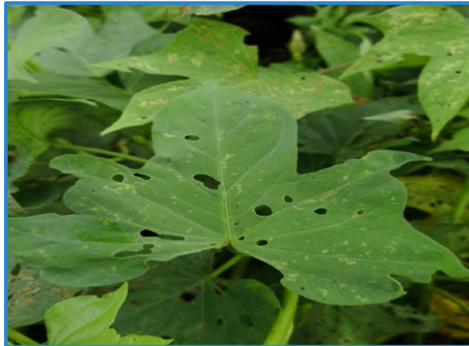
Figura 4. Daño en follaje causado por insectos. Pococí, Costa Rica, 2016.

Estos insectos se alimentan de las hojas, causando perforaciones, lo que disminuye la eficiencia fotosintética, en algunos casos puede sobrepasar los límites permitidos de poblaciones y se hace necesaria la aplicación de pesticidas para su control (Figura 4).