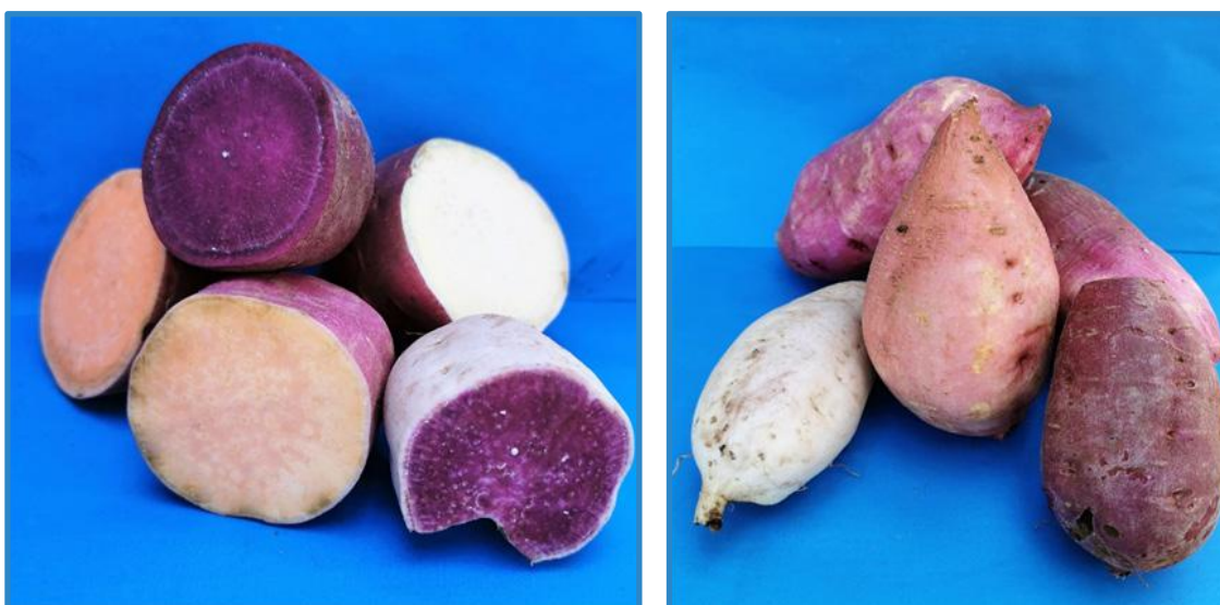
Camotes de diferentes accesiones. EELD, 2020.

Estas presentan gran variación, de coloración de la pulpa y de la cáscara, de forma y tamaño según el cultivar y tipo de suelo donde se siembren. El color de la cáscara puede variar desde el crema blanquecino, pasando por el anaranjado amarillento y rosado hasta el rojizo morado e intensamente morado. El color de la pulpa puede ser blanco, crema, amarillo, anaranjado o morado. Algunos cultivares tienen un color base de la pulpa con manchas o estrías de un color más oscuro (Muñoz 2012).