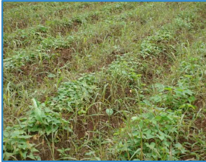
Figura 3. Cultivo de camote aplicado con fluziafop-butil para el combate de gramíneas. Pococí, Costa Rica, 2016.