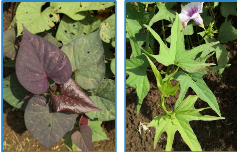
Hojas de diferentes accesiones de camote. EELD, 2019.