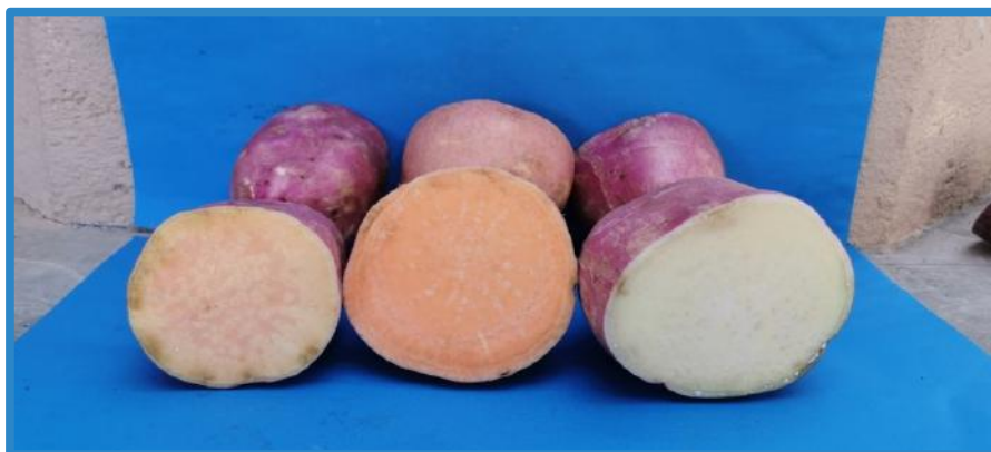
Figura 2. Principales variedades de camote cultivadas en nuestro país. Pococí, Costa Rica, 2020.