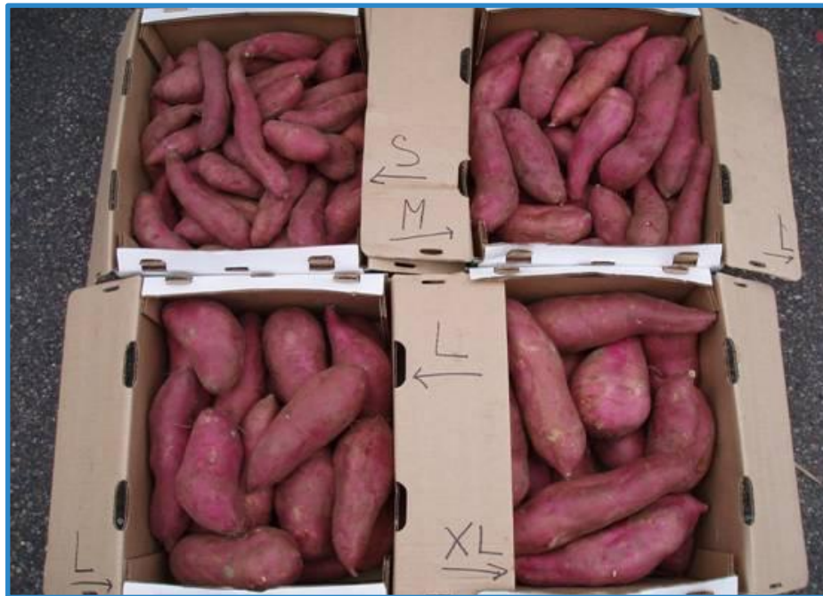
Figura 10. Clasificación de camote según su tamaño. Pococí, Costa Rica, 2016.

Para evitar pérdidas poscosecha por mala manipulación se recomienda empacar el producto, sin embargo, es importante mencionar que antes de empacarlo el mismo debe de estar seco, esto con el fin de evitar problemas de pudrición por el ingreso de agentes patógenos (Lardizábal 2003) (Figura 10).