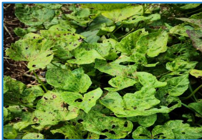
Figura 6. Virosis en camote. Pococí, Costa Rica, 2020.

Suele ocurrir clorosis (coloración verde pálido a blanquecina) del tejido foliar, muy contrastante con el verde normal. Dicha clorosis puede ser de toda la lámina foliar o bien parte de ella, usualmente ocurriendo entre nervaduras como en un “mosaico” (áreas cloróticas alternan con el verde normal) o bien como un “moteado”, o bien ocurriendo paralelo a las venas creando impresión de una red clorótica. Con menos frecuencia también pueden ocurrir hojas pigmentadas con coloraciones púrpura notorias (Figura 6).