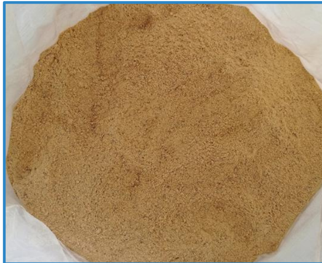
Figura 11. Harina de camote anaranjado. EELD, 2017.

El valor añadido (agregado) para los agricultores proviene de una variedad de productos e ingredientes hechos de la raíz del camote como son: harinas, fruta seca, jugos, panes, fideos, dulces y pectina. Entre los nuevos productos figuran licores y un interés creciente en el uso de los pigmentos de antocianinas de las variedades moradas como colorantes de alimentos y para diversos usos en la industria cosmética.