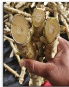
Figura 4. Estacas de yuca con médula blanca. Estación Experimental Los Diamantes. Guápiles. 2020

6. Las estacas o varillas son tomadas de la planta. La semilla de calidad debe contar con ciertas características: largo de estaca de 15 a 20 cm, seis nudos aproximadamente, médula blanca, nudos con distancias regulares (Figura 4).