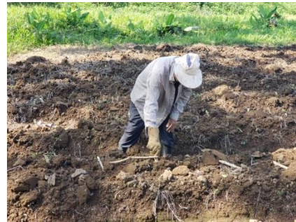
Figura 5. Proceso de siembra de estacas de yuca en vitrina de campo. Estación Experimental Los Diamantes. Guápiles. 2020.

8. Esta última etapa se puede realizar de forma inclinada o acostada, sobre el lomillo a una distancia de siembra de 0,7 metros entre plantas y de 1,5 metros entre lomillos. Lo anterior permite manejar una densidad de siembra de 16.000 plantas por hectárea (Figura 5).