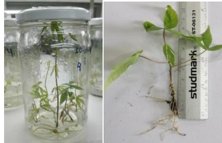
Figuras 2 y 3. Plantas de yuca en etapa de multiplicación y que han completado la etapa de desarrollo.

etapas: introducción (donde se realiza la limpieza del material vegetal), multiplicación (inicia cuando se obtienen plantas provenientes del medio estéril), desarrollo (previa a salir al invernadero) (Figuras 2 y 3) y endurecimiento (o aclimatación, pasando de condiciones de laboratorio al invernadero). En el caso de las plantas de yuca, los tejidos se obtienen a partir de estacas o varillas que son seleccionadas previamente en campo.