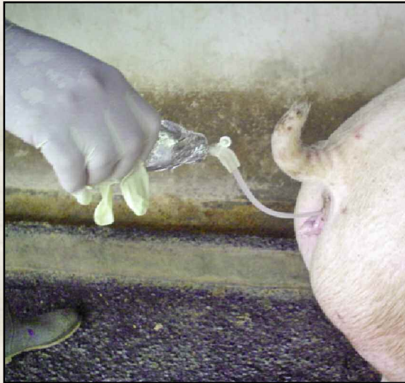
Figura 4: Aplicación de semen a cerda.

No olvide: guardar el semen en un sitio muy fresco y oscuro, no conviene en la refrigeradora ya que el frío mata los espermatozoides. Puede usar una hielera, el hielo debe estar separado unos 3 a 5 centímetros de la ampolla de semen.