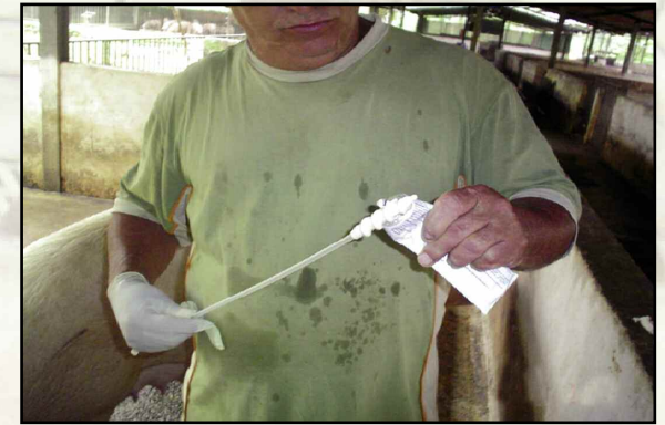
Figura 2: Aplicación de aceite a pipeta de inseminación