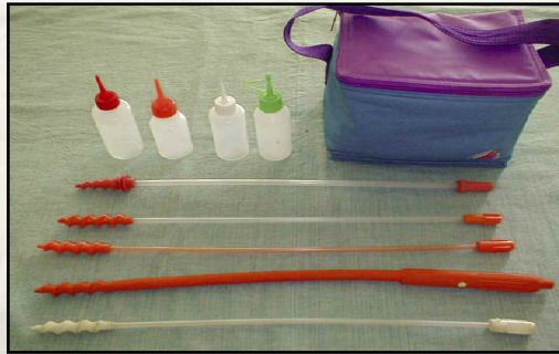
Figura 1: Equipo para realizar inseminación artificial en cerdas.