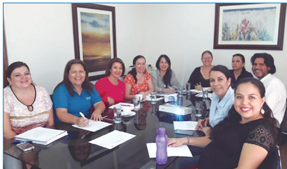
Figura 1. Sesión de trabajo de la Red Sectorial de Género y Juventud Rural.