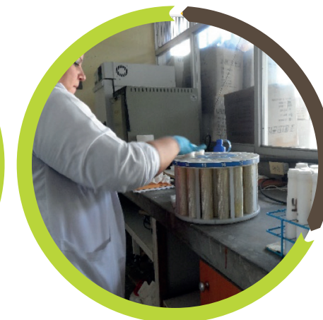
Figura 2. Digestión foliar.

El Laboratorio fue creado con el fin de apoyar al pequeño y mediano productor, capacitándolo para mejorar su producción, reduciendo el desperdicio de fertilizantes y asegurando que la planta reciba lo que requiere. Además, los análisis tienen un subsidio por parte del Estado, especialmente para los productores que participan activamente en las Agencias de Extensión.