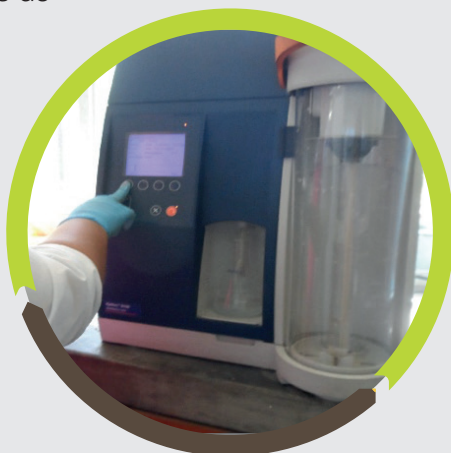
Figura 3. Destilador de nitrógeno (Micro Kjeldahl).