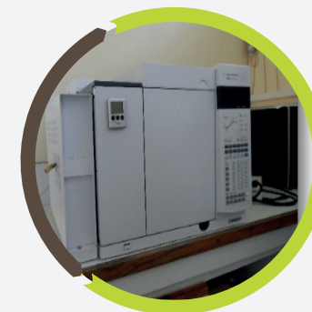
Figura 6. Absorción atómica (macro y micro elementos).