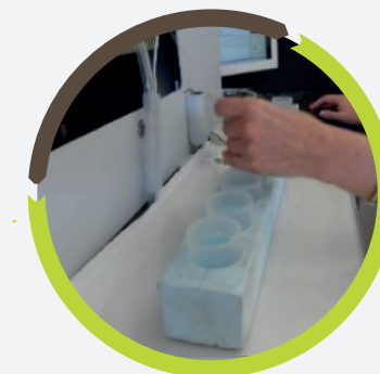
Figura 5. Titulación de aguas.