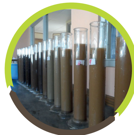
Figura 1. Análisis de texturas de suelo (Bouyoucos).