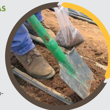
Figura 2. Toma de muestra de suelo.