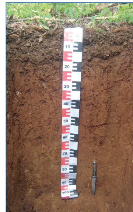
Figura 1. Perfil de suelo del orden Alfisol Nicoya, Costa Rica, 2011.