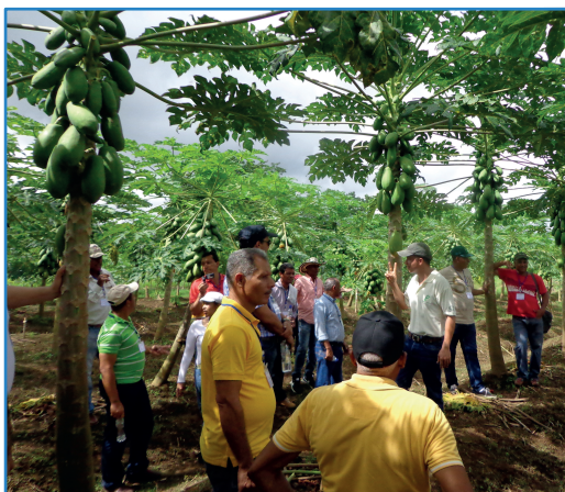
Figura 1. Promoviendo la participación y el aprendizaje, Costa Rica.

El fundamentar los procesos de extensión a través de las BPER, contribuye al alcance de los objetivos de la política del Sector Agroalimentario en seguridad alimentaria, equidad de género y juventud, cambio climático, competitividad y desarrollo territorial. El extensionista es un facilitador que promueve cambios en los sistemas de producción en los territorios rurales y que los usuarios sean sus propios tomadores de decisión (MAG 2015).